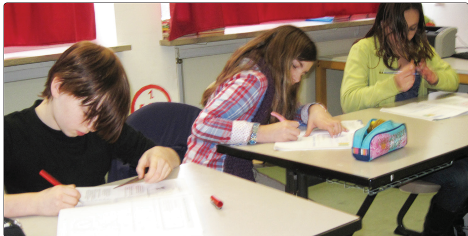
Selbstbestimmtes Arbeiten in der Studierzeit