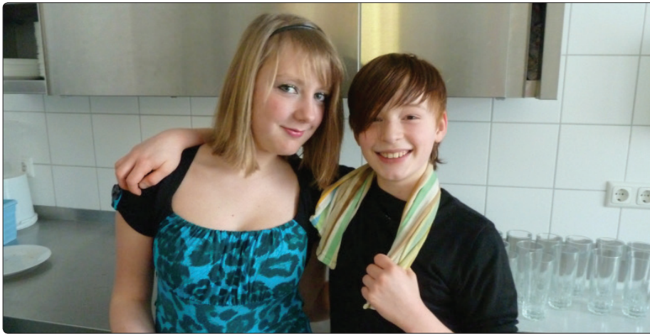
Küchendienst in der Mensa