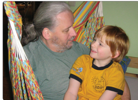
Familienmitglieder: Vater und Sohn